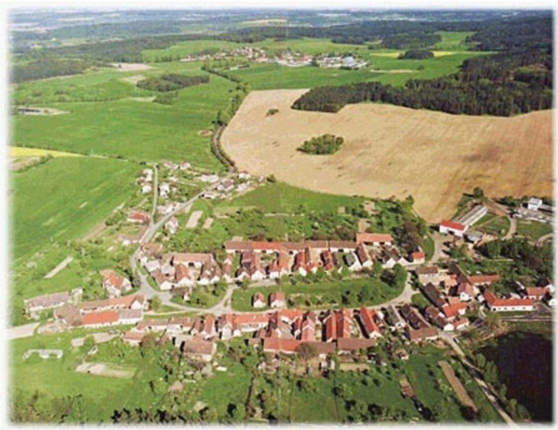
Holasovice, Netolice - poklad lidove architektury (víkend, kola)