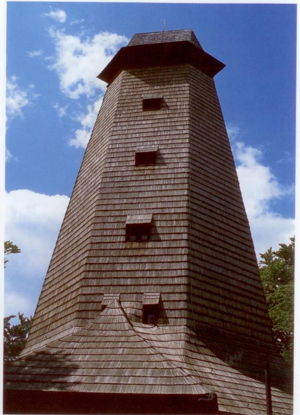
Dřevěná rozhledna na Blaníku připomíná obrannou věž.

Červená značka nás nakonec z Veliše dovede k Nesperské Lhotě , kde ji opustíme. Po neznačené silničce dojdeme k osadě Polánka , za níž překročíme železniční trať. Přes osadu Znosim pak pokračujeme až do výchozího bodu dnešního výletu.