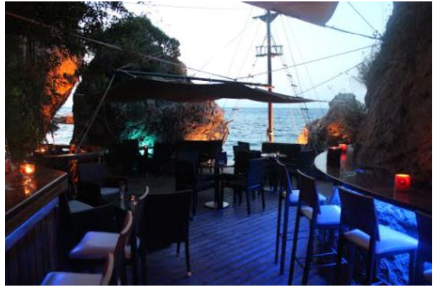
Rometzo Cafe Bar