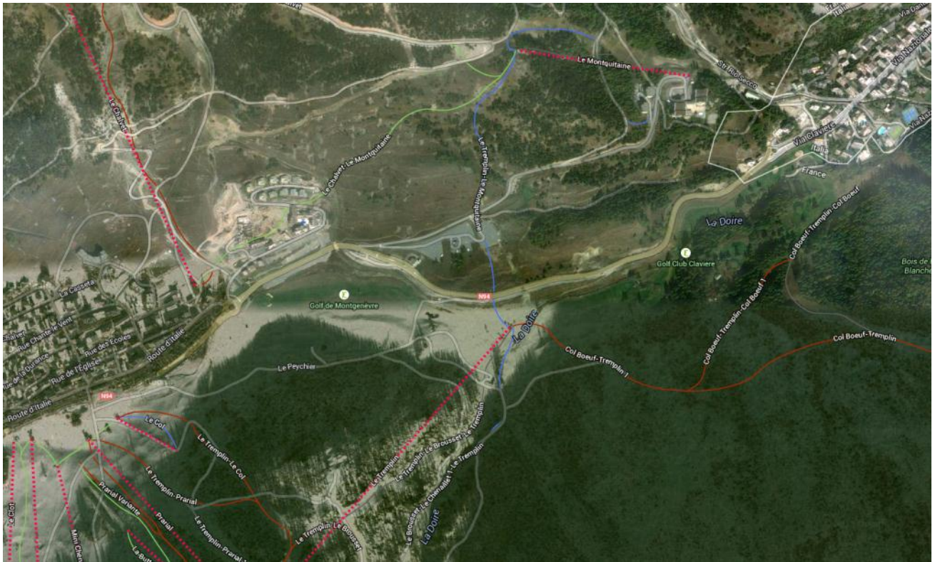
400 km sjezdovek