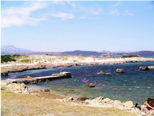
800 Porto Taverna: 40.859226°, 9.652216°