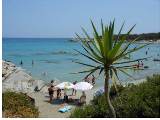
700 Capo Comino: 40.534415°, 9.817634°